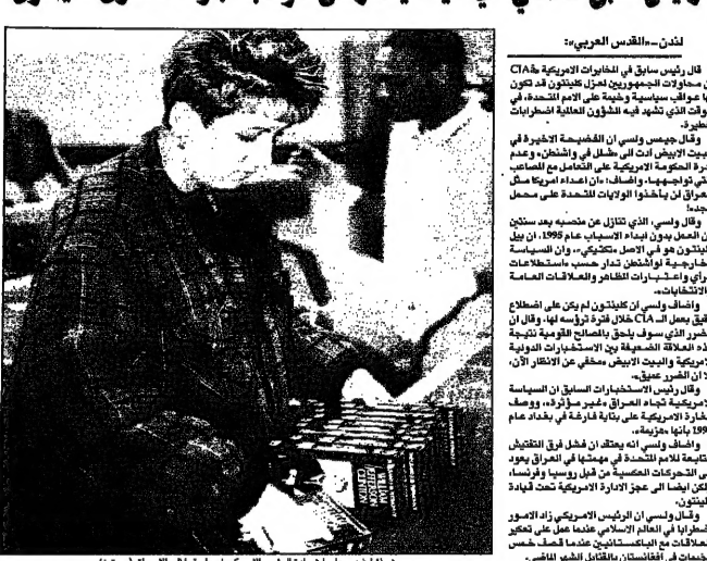
تحدث فيينا جيو حياطة رئيس الامم المتحدة في خريفها في الأسواق (رويترا)

لندن - «القدس العربي» قال رئيس سابق في الخيارات الامريكية CIA في محادثات الجمهوريين لعزل كلينتون قد تكون له عواقب سياسية وخيمة على عدم العمل على التوصل الى «حل وسط» مع الجمهوريين في البيت الابيض. وقال فيغرتش ما عدا كيبير من الجمهوريين في مجلس النواب الامريكى من معارفي من حرص الجمهوريين على اعادة اعادة العمل. وقال فيغرتش ما عدا كيبير من الجمهوريين في مجلس النواب الامريكى من معارفي من حرص الجمهوريين على اعادة اعادة العمل. وقال فيغرتش ما عدا كيبير من الجمهوريين في مجلس النواب الامريكى من معارفي من حرص الجمهوريين على اعادة اعادة العمل.